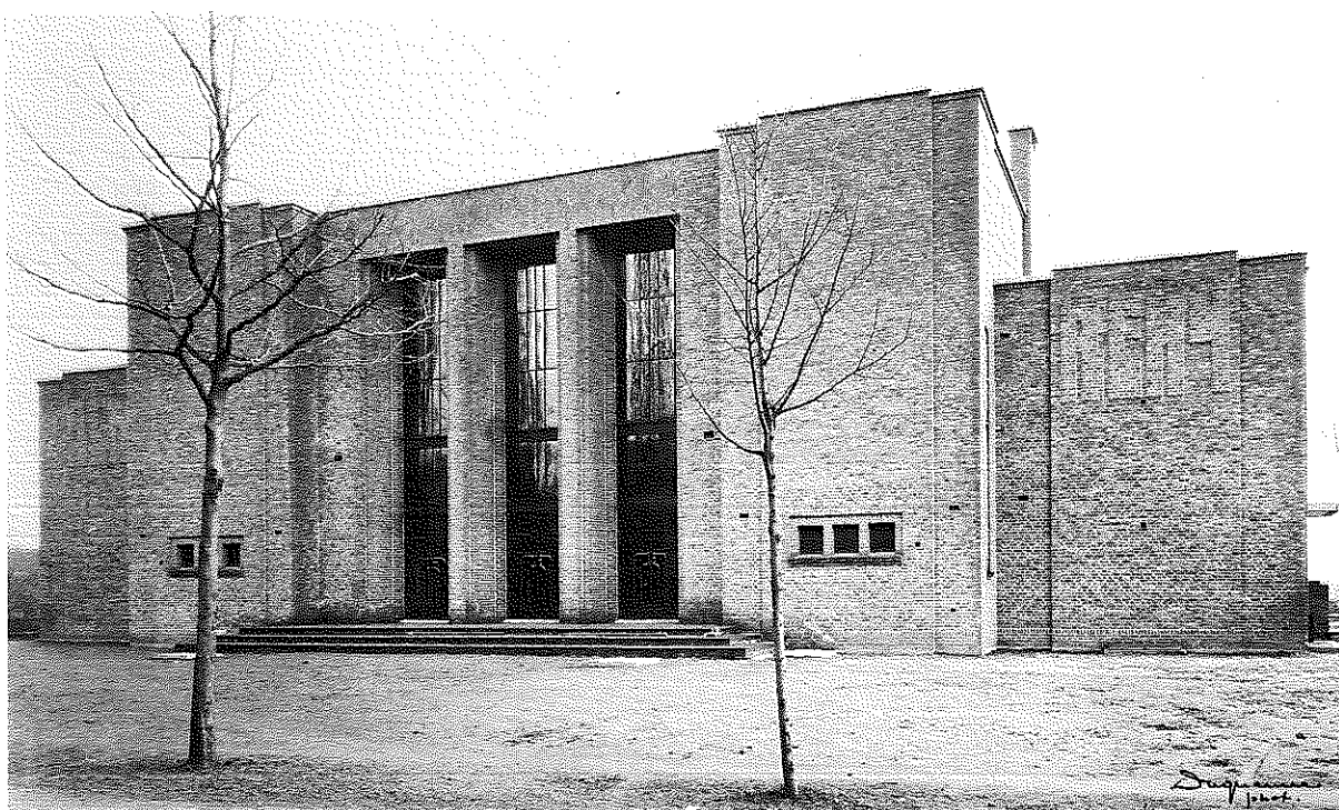
Salle des fêtes et dispensaire des Usines Remy à Wygmael, 1933.

Jean De Ligne a lui-même détruit la plus grande partie de ses archives. Parmi les 31 documents graphiques originaux conservés par le Musée, une dizaine seulement concernent la réalisation de maisons particulières. L'essentiel du fonds est constitué de carnets de croquis datant d'avant la première guerre mondiale et de dessins aquarellés (églises et chapiteaux romans) réalisés d'après nature en 1918.