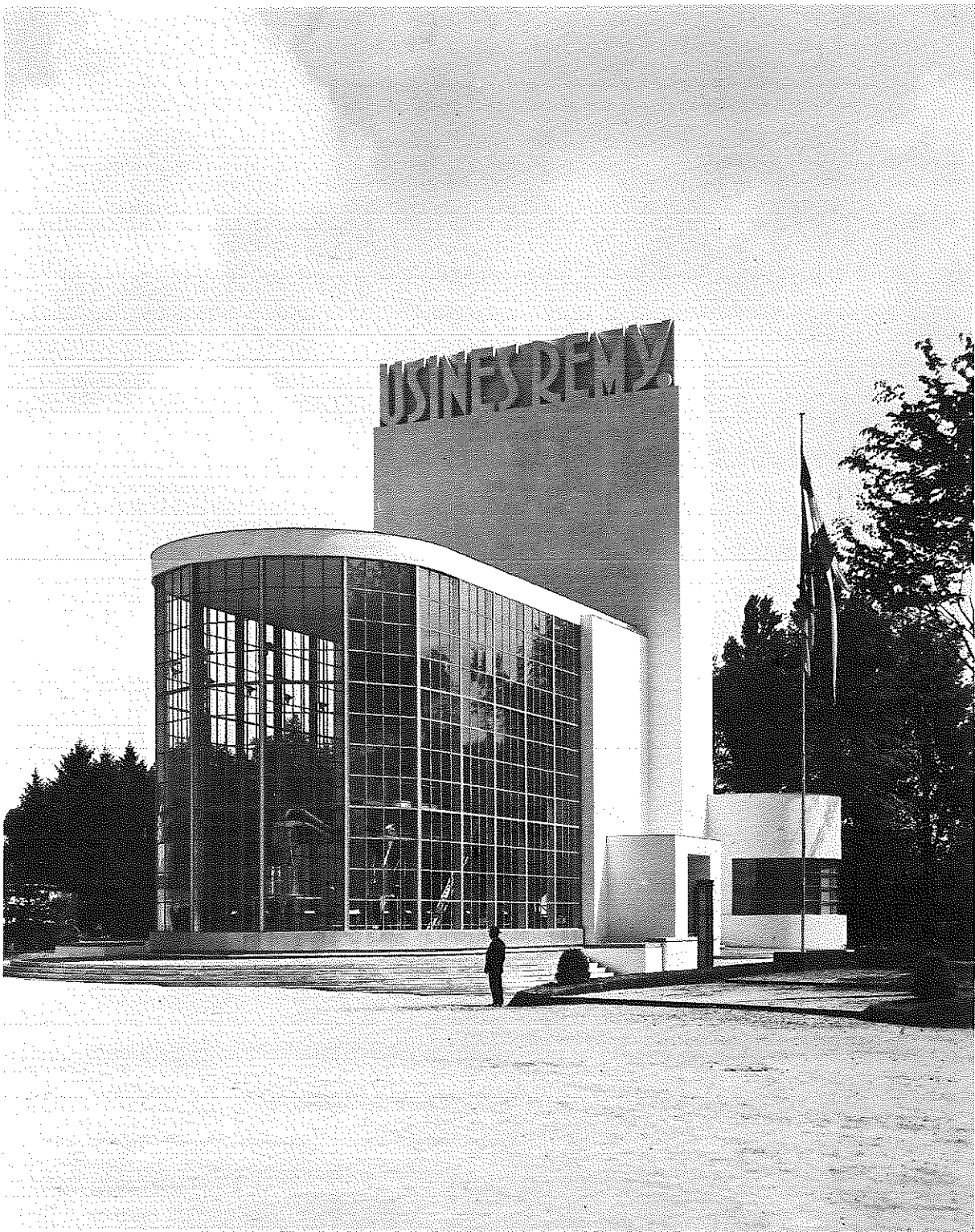
Pavillon des usines Remy à l'Exposition Universelle de Bruxelles en 1935.