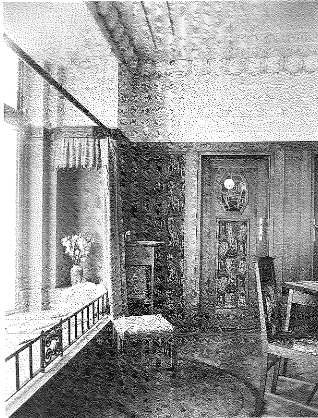
Maison avec magasin, rue Américaine 42 à Ixelles (Bruxelles), 1923. Photographie Duquenne.