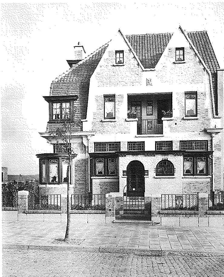
Maison, avenue du Roi Soldat 30 à Anderlecht (Bruxelles), 1927. Photographie d'époque.