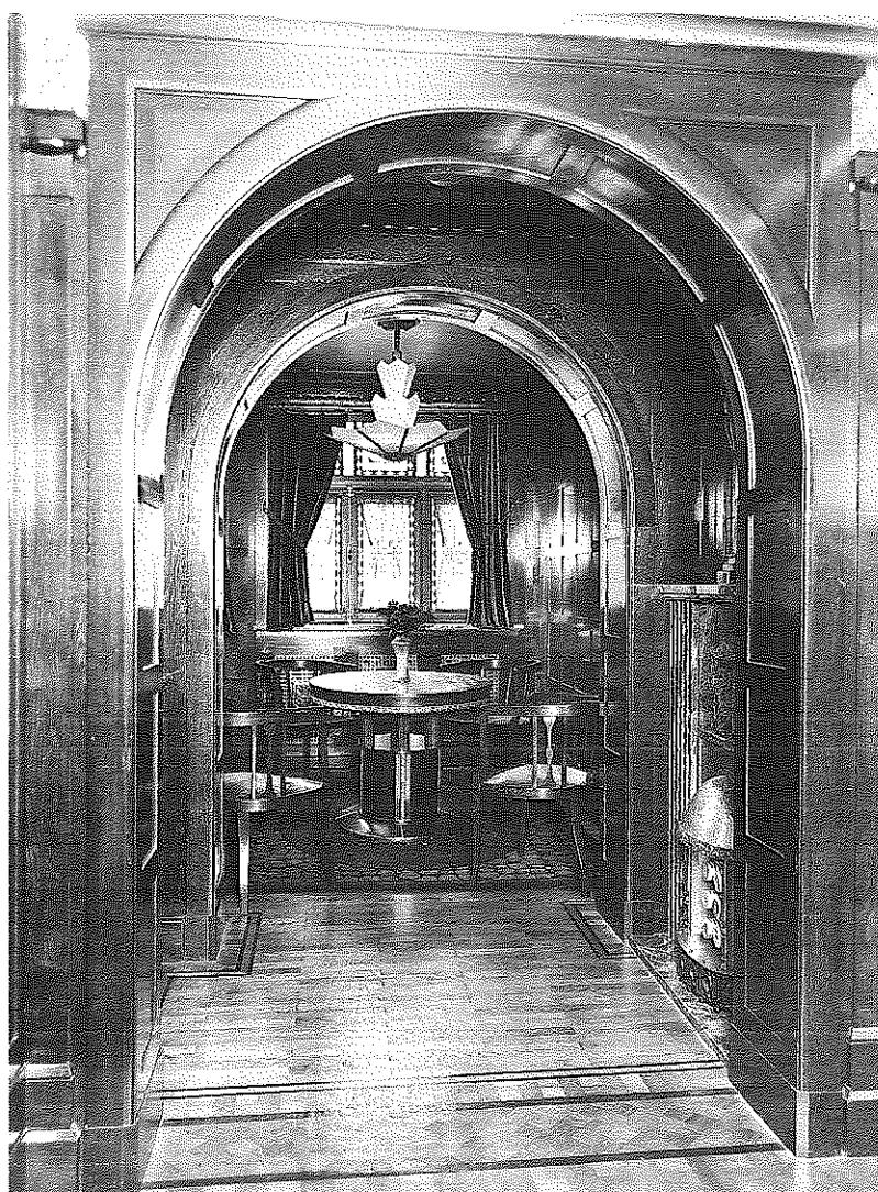
Intérieur non identifié.