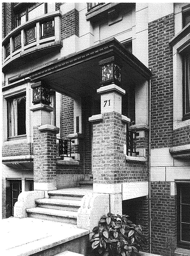
Maison, avenue du Wolvendael 71 à Uccle (Bruxelles), 1926.