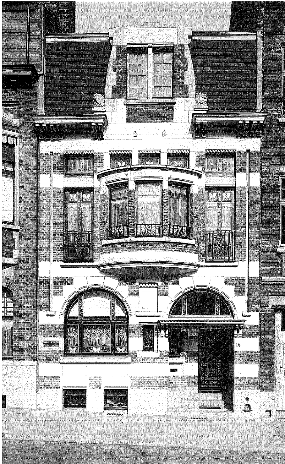
Maison, avenue V. et J. Bertaux 14 à Anderlecht (Bruxelles), 1924. Photographie d'époque.