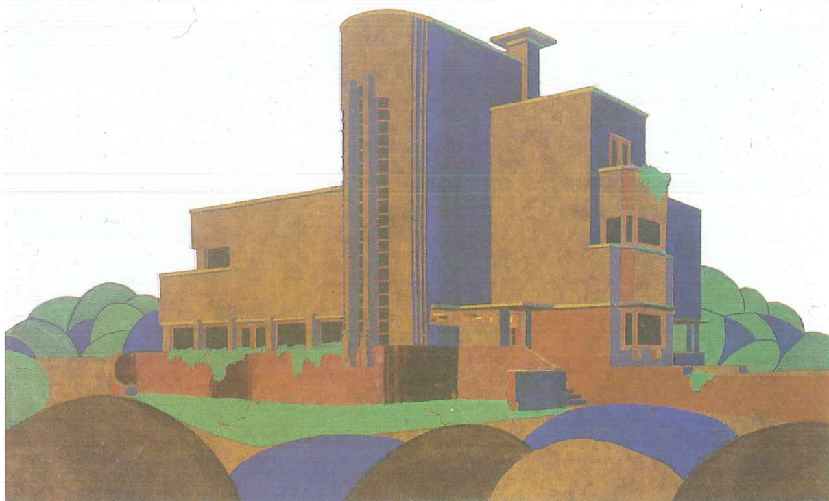
Pierre Verbruggen. Villa de M. Goethals à Bruxelles, 1923. Crayon et gouache sur papier brun. 353 × 610.